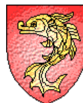
Guigues de Forez

Guy de Dampierre (~1225-1305) Comte de Flandre. Marquis de Namur.