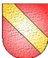
Hugues de Noailles

Seigneur de Noailles. (-1248) Vassal de Raymond VI de Turenne.