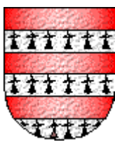
Raymond II de Trencavel

Guigues VI de Forez (12?-1259) Comte de Forez (1241-1259).