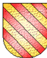
Raymond VI de Turenne

La ville de Carcassonne lui est brièvement restituée entre 1224 et 1226. Le Vicomte Raymond de Trencavel participe à la septième croisade en Terre Sainte, accompagné de chevaliers méridionaux. Il décède entre 1263 et 1267.